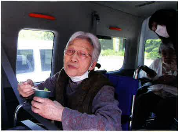
静かに、密集、密接、密閉をさけて、 こそっとドライブ 🚗