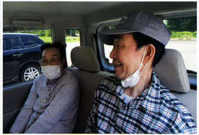
やっぱり外はいいな。 自然と笑顔。