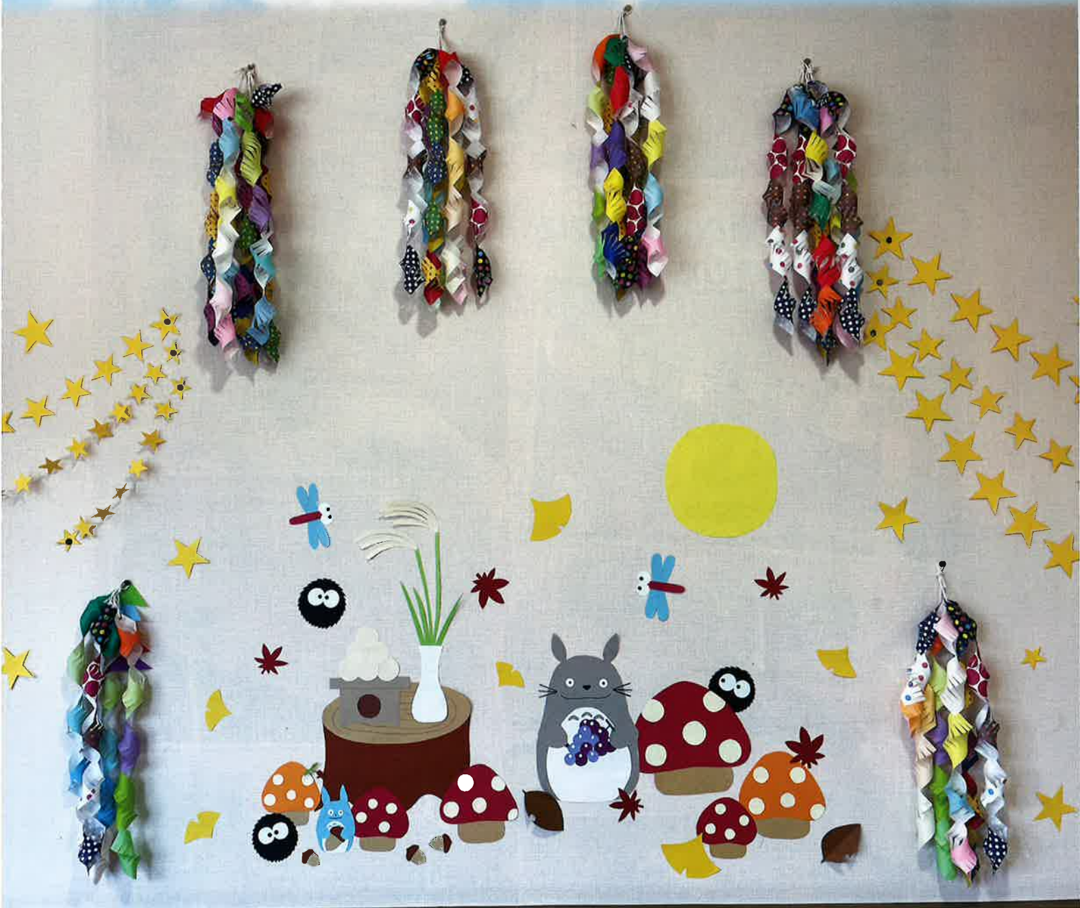
秋の壁面飾り（田沢の郷）